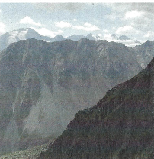
Weg zur Regensburger Hütte

ca. 4 ½ Std. Wanderung (mittelschwer) zur Regensburger Hütte → Übernachtung